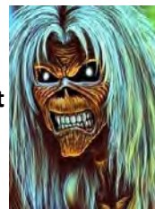
Jolie coiffure Brizitte!

Des idiots de plateaux télé qui braillent « en Namérique on travail jusqu'à 80 ans!! Jusqu'à la mort!! » ? Sérieusement ?